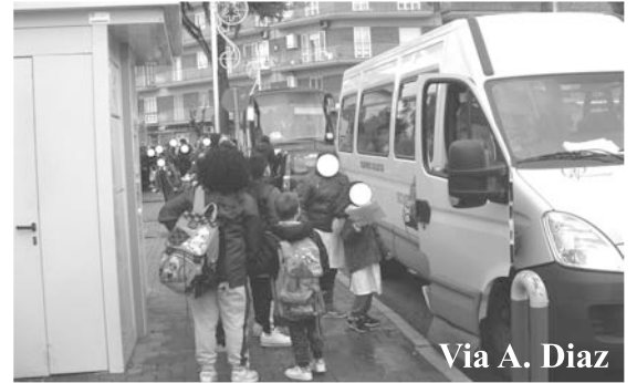
Via A. Diaz