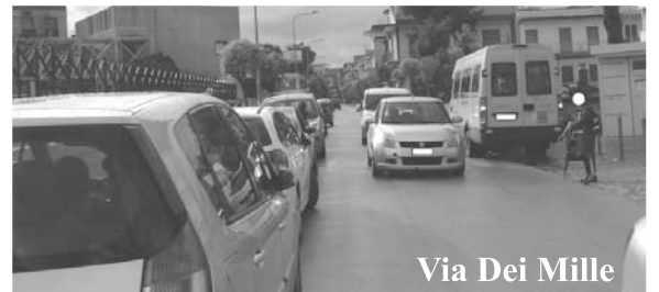
Via Dei Mille