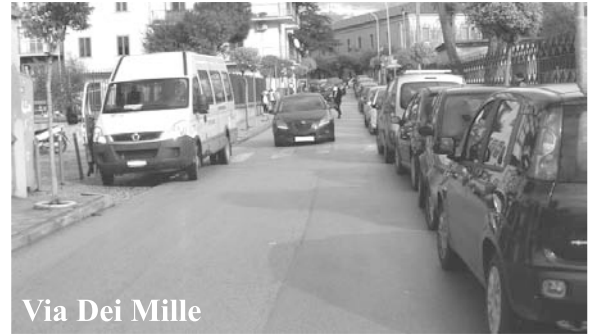
Via Dei Mille