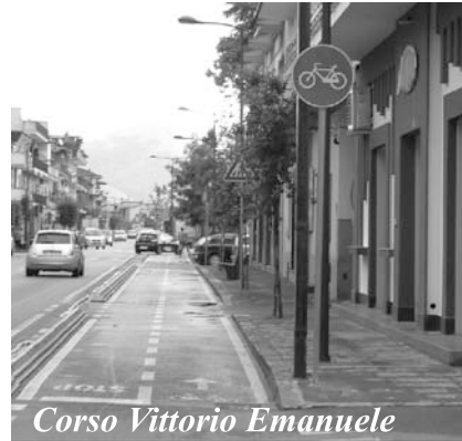
Corso Vittorio Emanuele

Presenza di passi carrabili , ossia qualora lungo l'itinerario siano presenti dei passi carrai che, per elevata frequenza e/o flussi di entrata e di uscita, costituiscono un'importante interferenza con il flusso ciclabile, dev'essere valutata la scelta di interrompere la pista ciclabile e dev'essere sostituita con il percorso promiscuo. Ma quello che adesso ci hanno segnalato alcuni cittadini , è l'assenza della segnaletica verticale, che indichi ai ciclisti, che il percorso a loro riservato è interrotto, quando vi sono strade laterali, che si