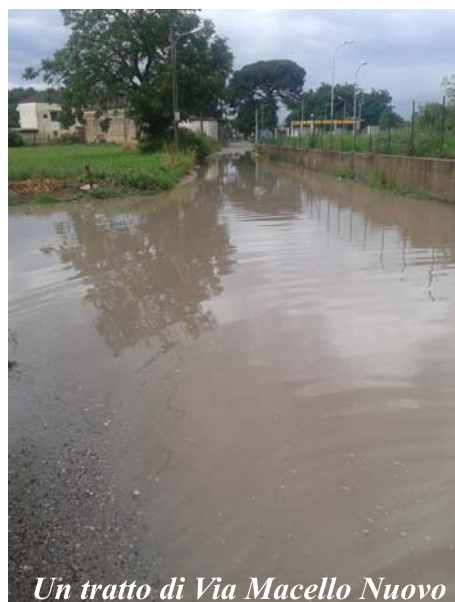
Un tratto di Via Macello Nuovo

Intanto è polemica in città per i disagi che l'ondata di maltempo ha causato. Molti i post sulla pagina di facebook del Sindaco, Raffaele Lettieri , di accusa nei confronti di un'amministrazione comunale, che penserebbe e si impegnerebbe ad organizzare eventi e manifestazioni, tralasciando interventi fondamentali come la manutenzione delle strade e del sistema fognario.