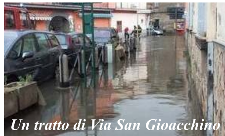
Un tratto di Via San Gioacchino

In questi giorni sono stati diversi gli interventi delle squadre di soccorso per allagamenti di cantinole e di strade. Pervenute anche segnalazioni di allagamenti in appartamenti, dove proprietari ed affittuari hanno dovuto liberare le case dall'acqua".